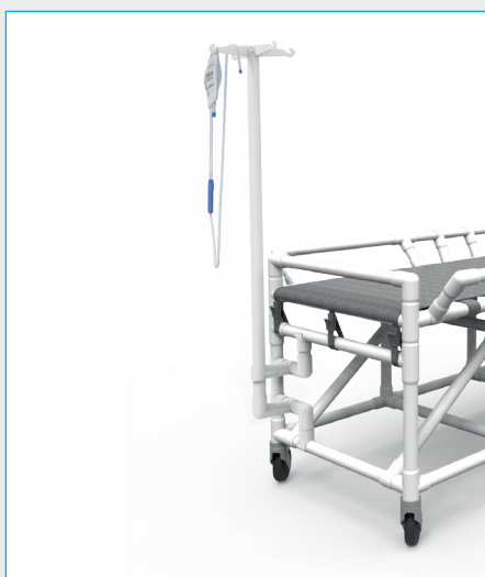
Asta porta flebo