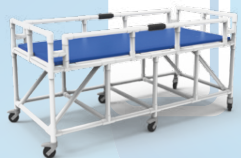
BRM 001 B

La barella amagnetica MR Safe BRM 001 è disponibile anche in versione bariatrica BRM 001 B con portata fino a 250 kg, larghezza maggiorata e 6 ruote, di cui 4 con freno.