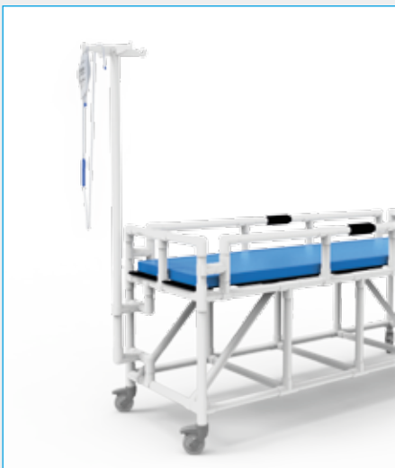
Asta porta flebo